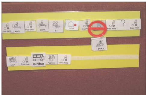
Urnik z abstraktnimi simboli in ključnimi besedami (simbol odnese s sabo in je kažiplot do naslednje aktivnosti)